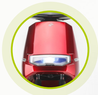
Fari FULL LED