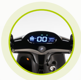
Display digitale adattivo