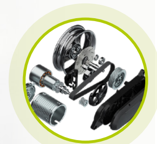
Potente motore ultracompatto integrato nel forcellone